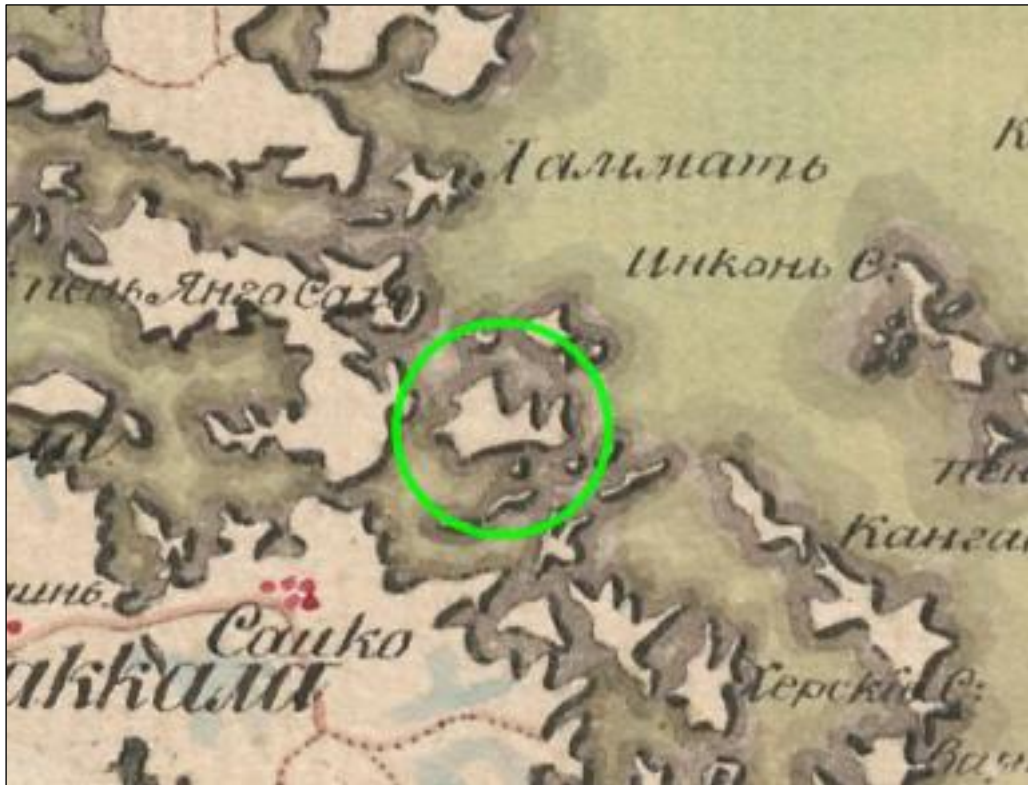
Päiviösaari (vihreän ympyrän sisällä) vuoden 1805 Viipurin läänin kartassa (Aflidne Excellencen grefve Steinheils Karta öfver Wiborgs län 1805). Lähin asutus on merkitty (punaisella) mantereelle Saikonkylään.