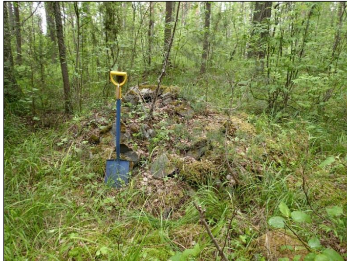
Alakohde 1 B. Raivausröykkiö, ilmeisesti kaskiröykkiö, Kuvattu luoteeseen.