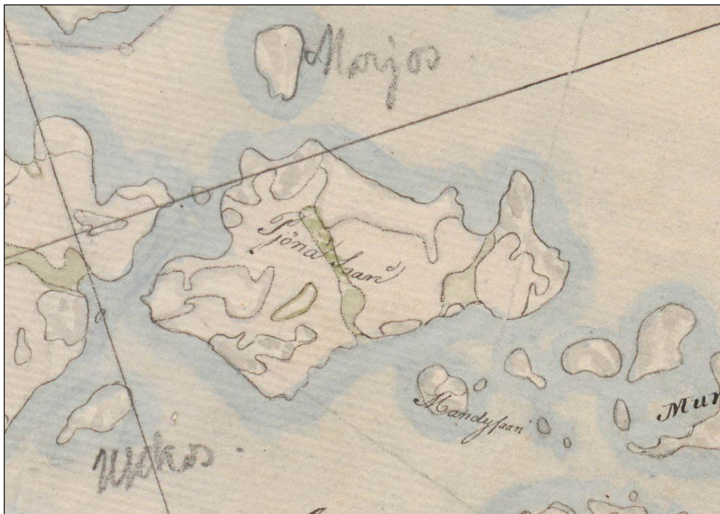
Vuoden 1843 pitäjänkartalla Päiviösaarelle on merkitty vain metsää, kalliota ja niittyä.