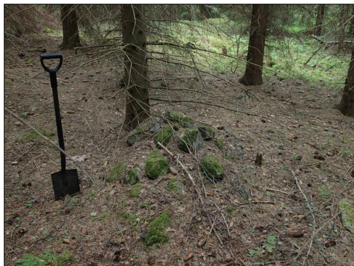
Raivausröykkiö kohdassa N 6786 170 E 566 009. Lounaasta.