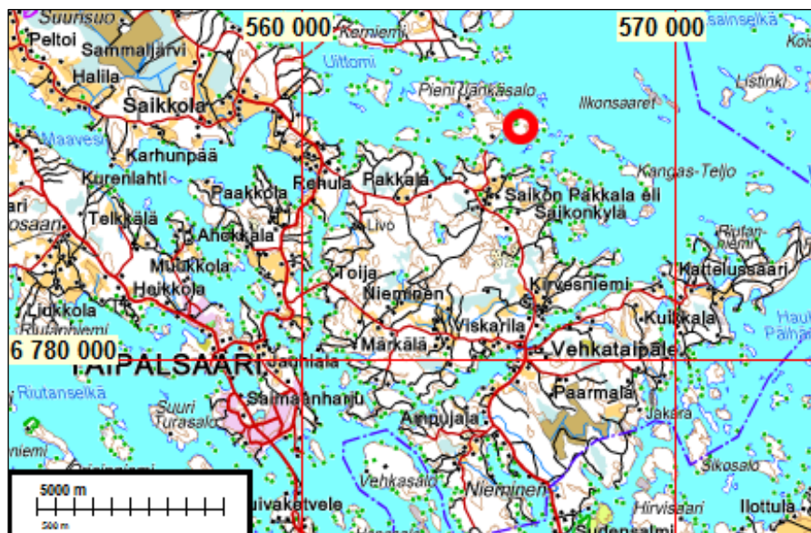
Inventointialue on merkitty punaisella renkaalla.

Selityksiä: Koordinaatit ja kartat ovat ETRS-TM35FIN koordinaatistossa (Euref). Kartat ovat Maanmittauslaitoksen maastotietokannasta kesältä 2015 ellei toisin mainittu. Valokuvia ei ole talletettu mihinkään viralliseen arkistoon eikä niillä ole mitään kokoelmatunnusta. Valokuvat digitaalisia. Valokuvat ovat tallessa Mikroliitti Oy:n serverillä. Kuvaajat: Ville Laakso ja Timo Sepänmaa. Kohteiden numerointi on epävirallinen, vain tämän raportin karttaviihteiksi.