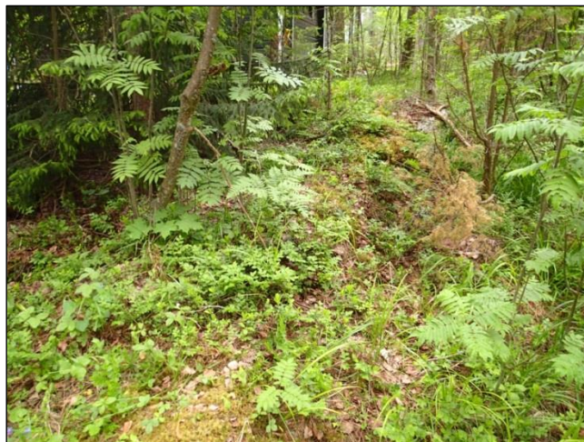
Alakohde 1 A. Röykkiön pohjoiskoillislaitaa. Kuvattu koilliseen.

Alakohde 1 B: (N 6785 931 E 565 878, Z: 79): Paikalla on rinteessä suureksi osaksi kiven päälle tehty kivikasa, halkaisijaltaan 2,5 m, korkeudeltaan noin 25 cm. Ympäristö on mäntyvaltaista moreenimaastoa, pihapiirin pohjoislaitaa. Ilmeisesti kaskiröykkiö.