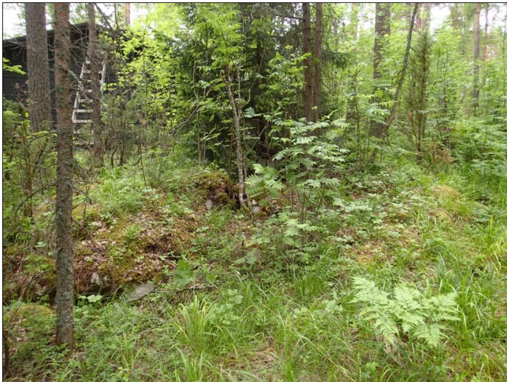
Alakohde 1 A. Röykkiö kuvattuna kaakosta. Etualan kiveys on kallion päällä. Röykkiö jatkuu kuvan keskellä olevien pienten puiden alta taka-alalle, taustalla näkyvän mökin oikeanpuoleisen kulman suuntaan.